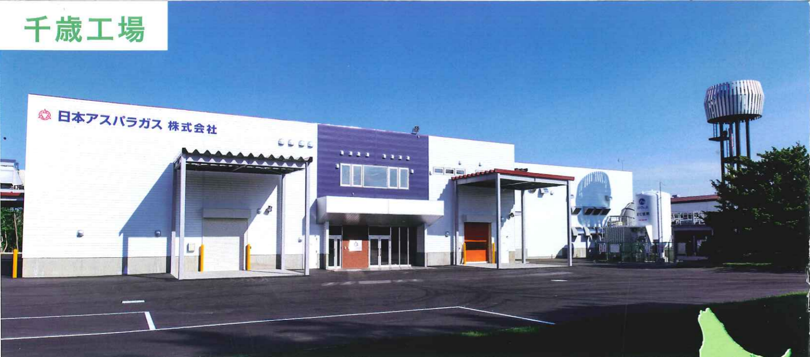
アセプティック充填ライン (Aライン) 外観