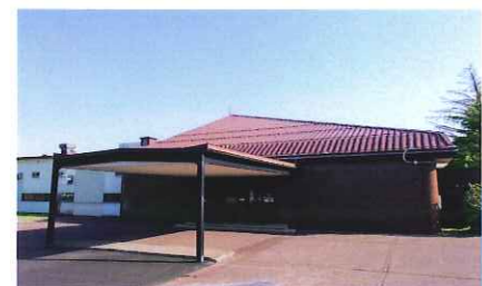
ホットパック充填ライン (Bライン)・事務所外観