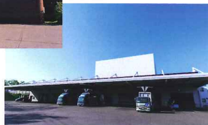
配送センター外観